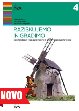
samostojni delovni zvezek