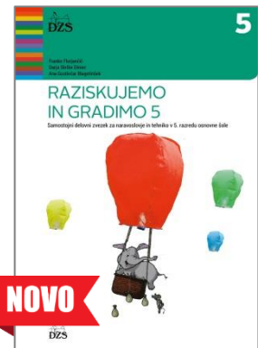
samostojni delovni zvezek

Tako lahko za novo šolsko leto izbirate med naslednjimi gradivi: